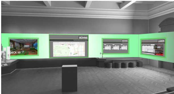
Bühne - Präsentationsformate