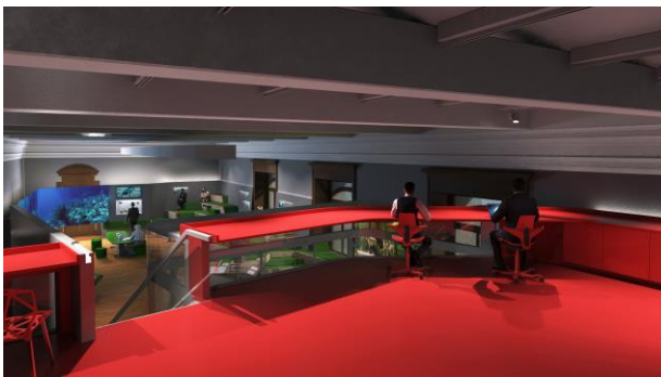
Labor – Raum im Raum