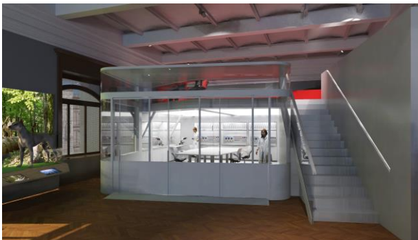
Labor – Raum im Raum